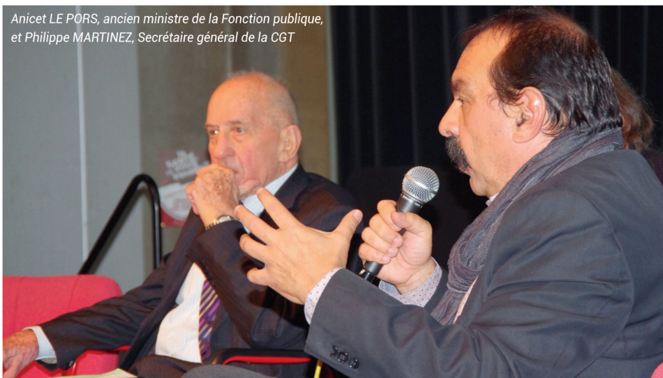
Anicet LE PORS, ancien ministre de la Fonction publique, et Philippe MARTINEZ, Secrétaire général de la CGT

Philippe Martinez : « ... La conception de citoyen fonctionnaire au service du citoyen usager est plus que jamais d'actualité et moderne, dans un monde et dans une société où les repères collectifs et les notions de solidarité citoyenne et de fraternité sont gommés... »